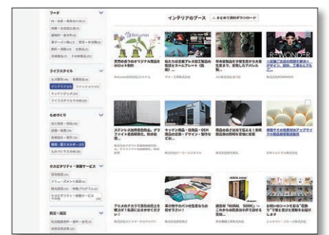
出展者ページイメージ